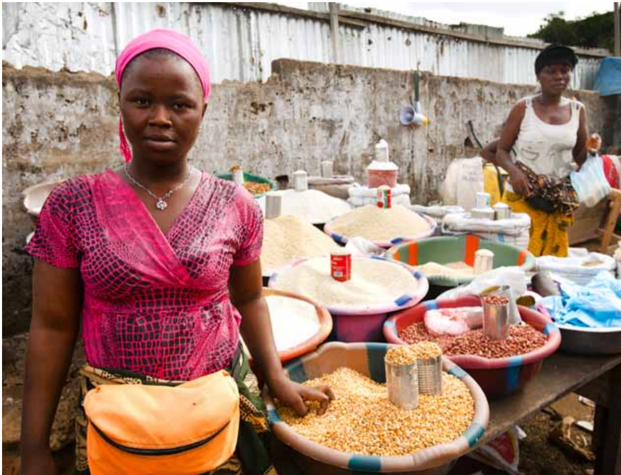
Sodexo soutient les PME gérées par des femmes pour les aider à améliorer la qualité et les standards de leur production et ainsi mieux satisfaire leurs clients.