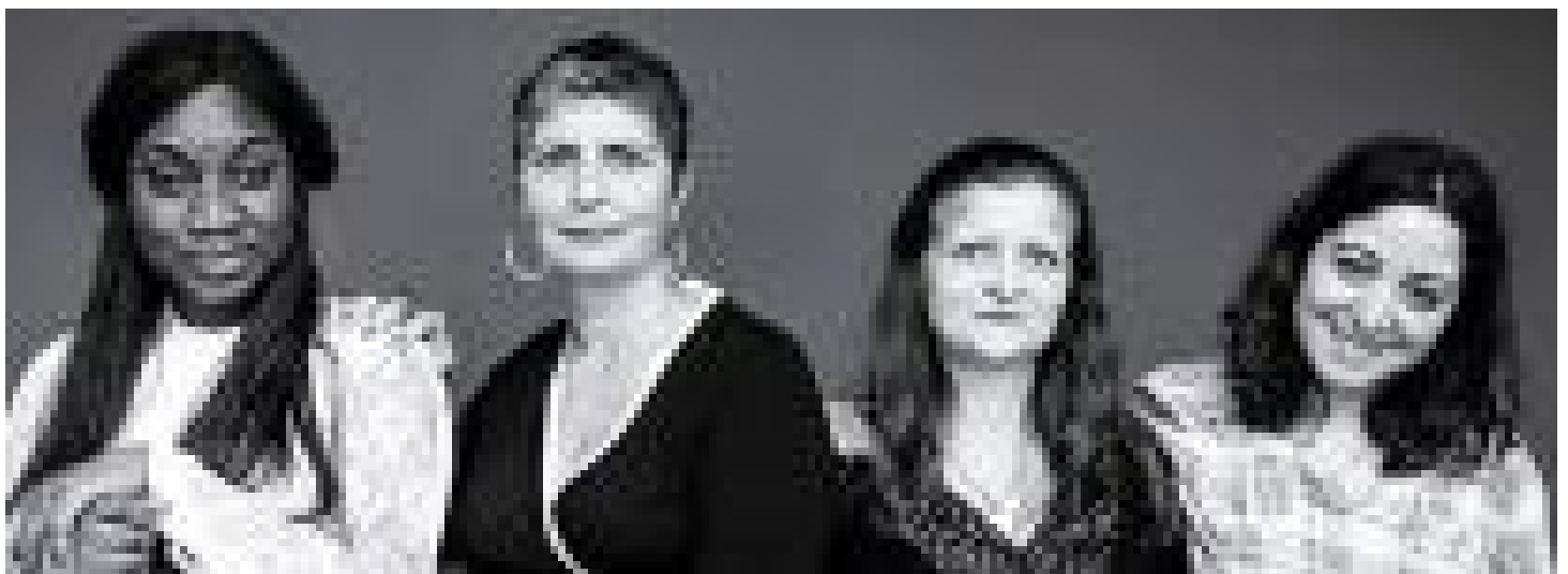
Diversité : Humando Pluriels mise sur le recrutement « zéro CV »